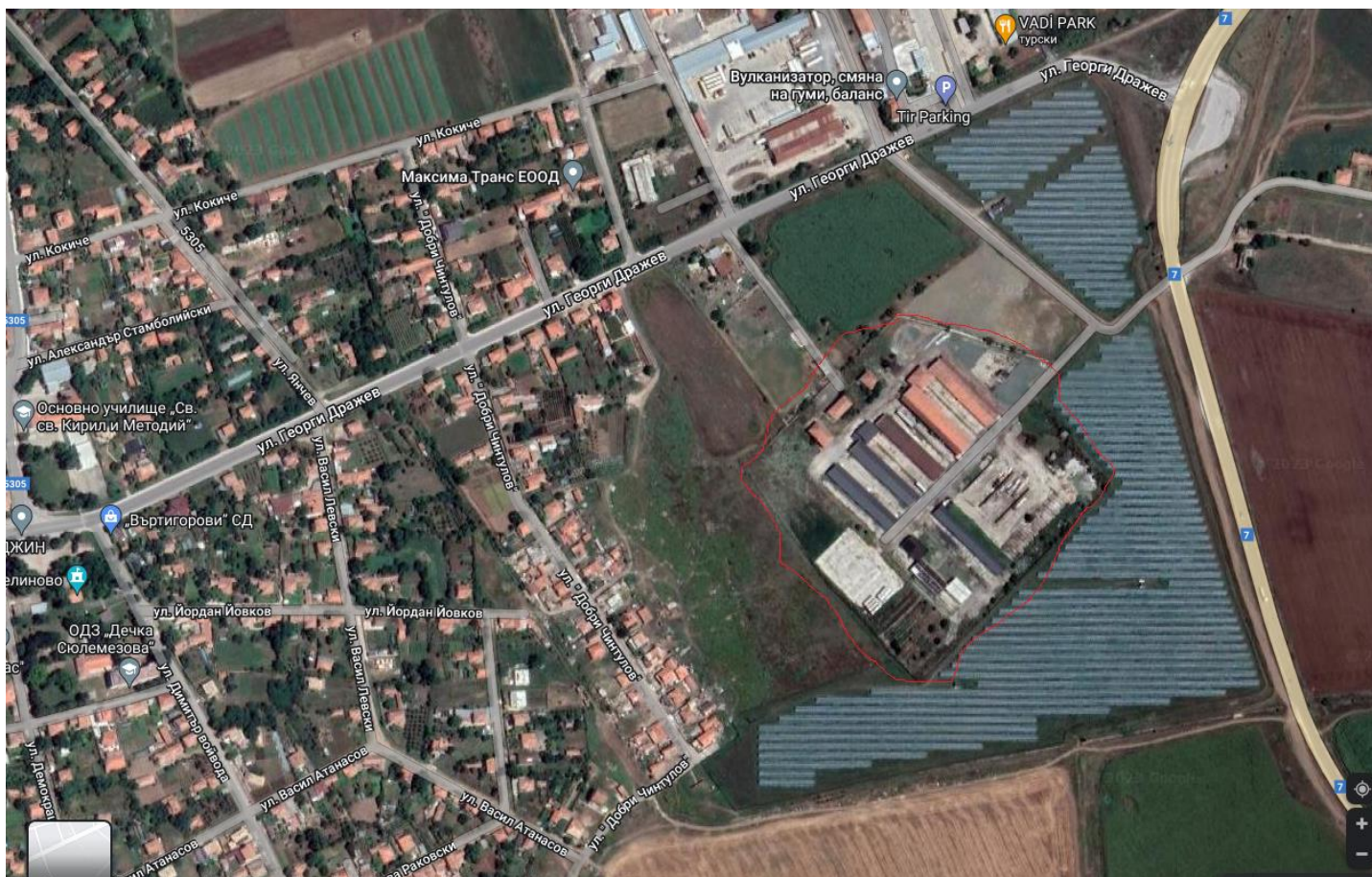
Фиг. 2. Местоположение на инвестиционното предложение