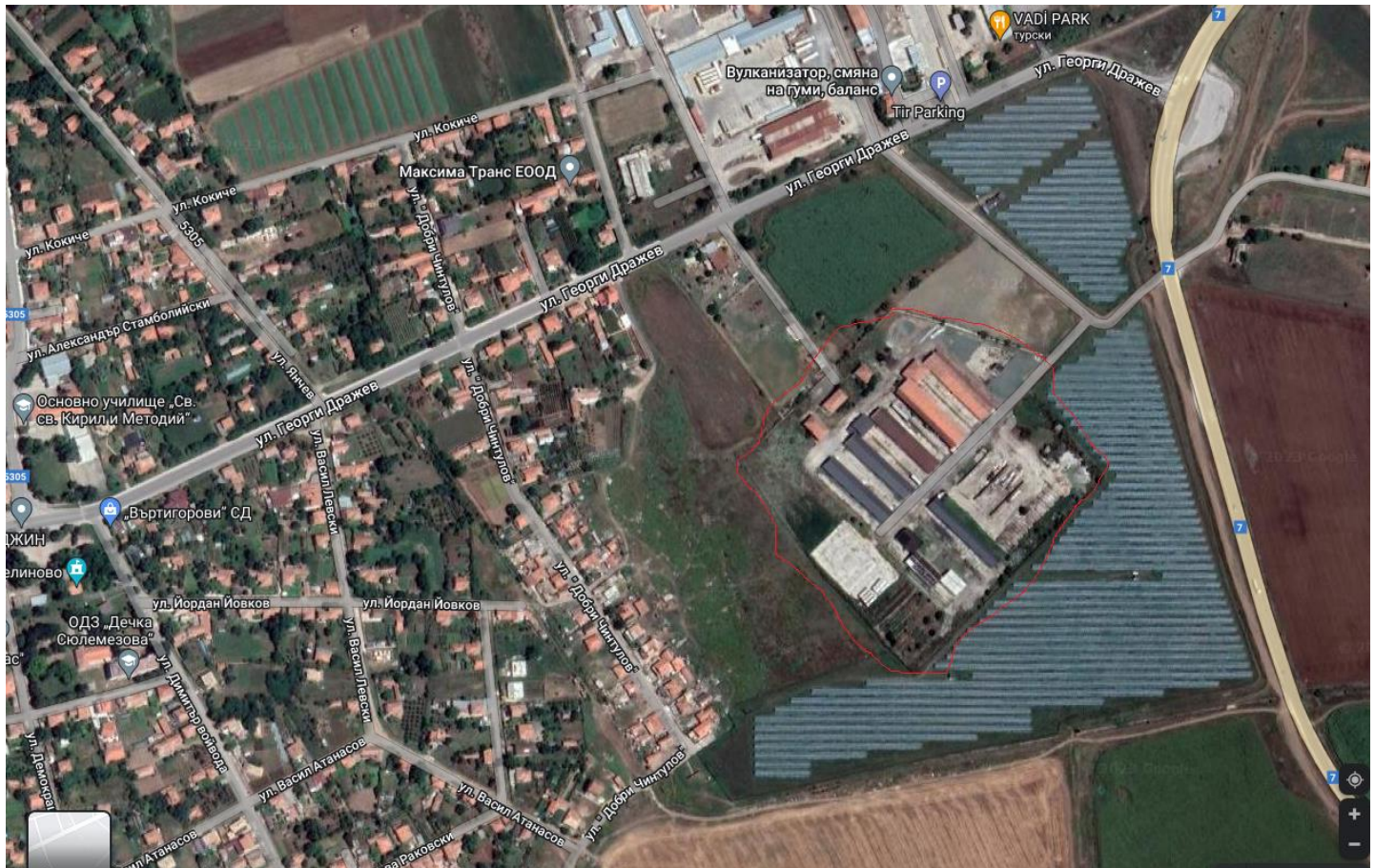
Фиг. 1. Местоположение на инвестиционното предложение

2. Местоположение на площадката, включително необходима площ за временни дейности по време на строителството.